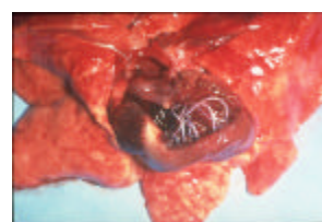
Vers du cœur ( Dirofilaria immitis )