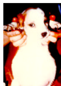
Chiot infesté d'ascaris ( Toxocara canis )