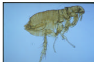
Une puce ( Ctenocephalides felis )

Le développement des formes nymphales en adultes (le cycle de la puce est alors bouclé), exige des conditions précises de température et d'humidité, réunies presque toute l'année.