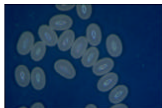
Les œufs de puce

Pensez donc à protéger votre animal contre les puces toute l'année