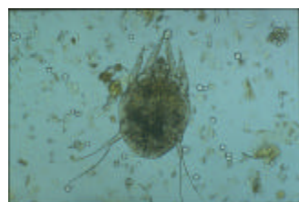
Gale des oreilles ( Otodectes cynotis )

Ce prurit infernal s'explique par le creusement de véritables galeries dans l'épiderme par les agents de la gale du corps , et par l'inflammation qu'ils provoquent.